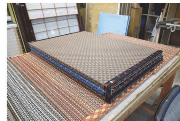
持ち運び可能な「TATAMI TATAMI」は外出用にも使える便利な新商品①

スをとらないので、持ち運びが便利につくりとなっている。家の中のフローリングスペースに敷くことはもちろん、洗うことができるので外出先でも使え、川や海、お花見、運動会などでも使用できる。デザインもおしゃれで、女性からの人気が高い。今後は首都圏で開催される展示会への出展も検討。若い世代にもっと畳の良さを知ってもらえるように活動を展開していく。