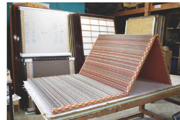
持ち運び可能な「TATAMI TATAMI」は外出用にも使える便利な新商品②