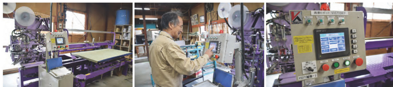
補助金を活用して導入した製畳用ロボット

それらを活用して操作方法の習得・試作・試作評価を行い、高機能薄畳の生産体制の確立を目指した。